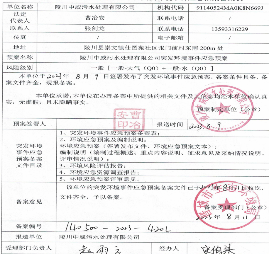
晋城市生态环境局企业事业单位突发环境事件应急预案备案表

注: 备案编号由企业所在地县级行政区划代码、年份、流水号、企业环境风险级别 (一般 L、较大 M、重大 H) 及跨区域 (T) 表征字母组成。例如, 河北省永年县**重大环境风险非跨区域企业环境应急预案 2015 年备案, 是永年县环境保护局当年受理的第 26 个备案, 则编号为: 130429-2015-026-H; 如果是跨区域的企业, 则编号为: 130429-2015-026-HT。