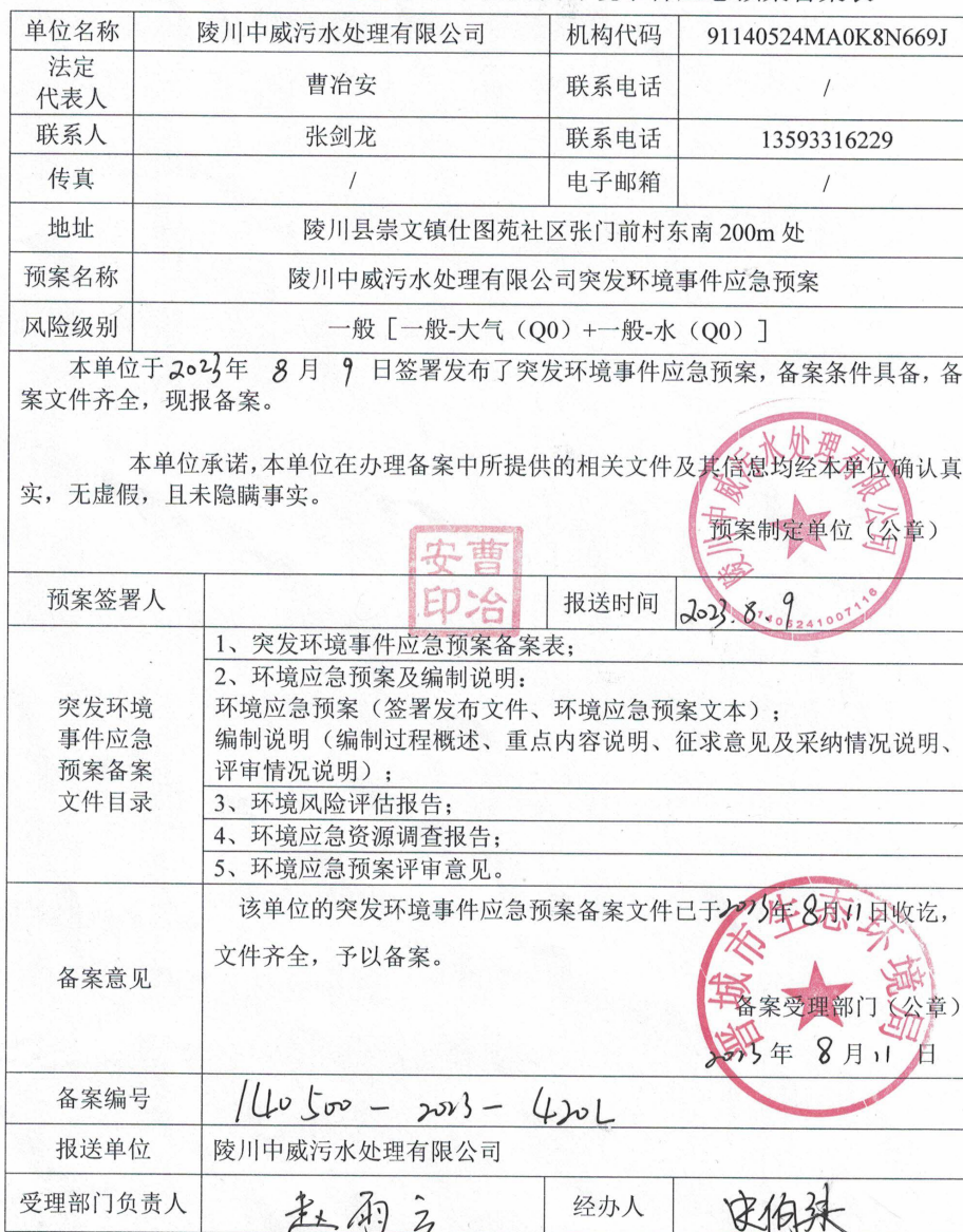
晋城市生态环境局企业事业单位突发环境事件应急预案备案表

注: 备案编号由企业所在地县级行政区划代码、年份、流水号、企业环境风险级别 (一般 L、较大 M、重大 H) 及跨区域 (T) 表征字母组成。例如, 河北省永年县**重大环境风险非跨区域企业环境应急预案 2015 年备案, 是永年县环境保护局当年受理的第 26 个备案, 则编号为: 130429-2015-026-H; 如果是跨区域的企业, 则编号为: 130429-2015-026-HT。