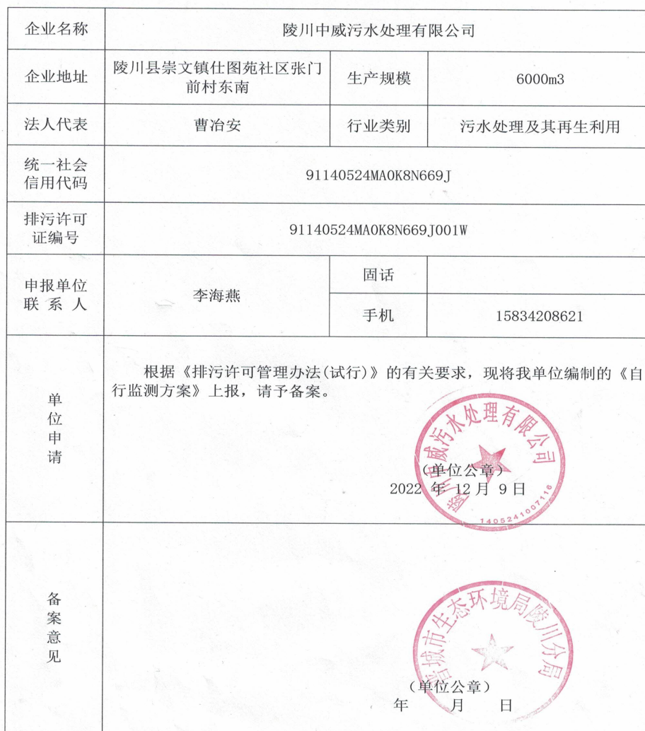
企业自行监测方案备案表